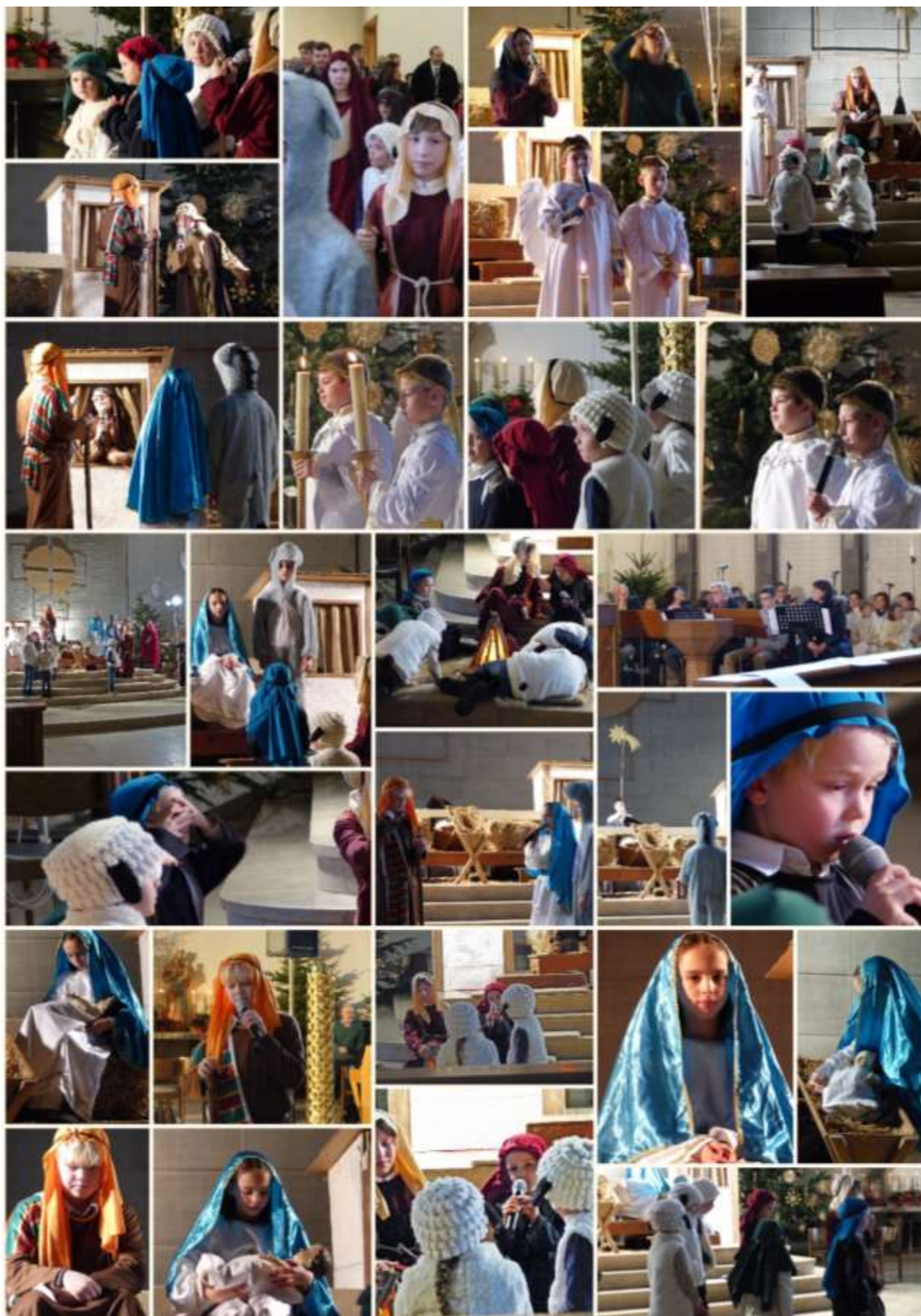
Impressionen vom Krippenspiel am Heiligen Abend in St. Joachim